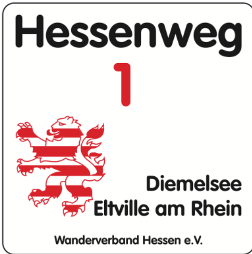
Hessenweg-Kennzeichnung (Neues Markierungszeichen)

Hessenwege werden im Detail erläutert und beschrieben auf der Homepage des Wanderverbandes Hessen und auf der Wanderwegeapp von Hessen-Tourismus .